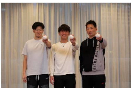
【トラが誇るサウスポーがトリオでテーマトーク！ マウンドではクールなあの左腕が…!?】