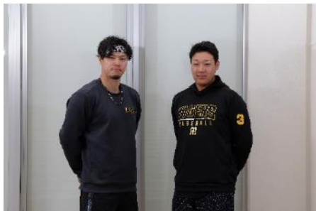
【2023 猛虎打線の核はオレたちだ！】