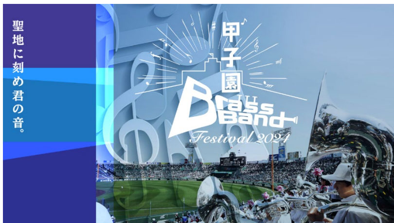
<ビジュアルイメージ>