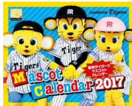
阪神タイガース マスコットカレンダー-2017 (卓上タイプ:表紙)