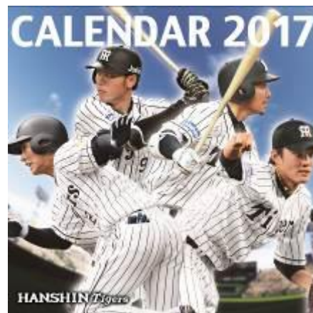
阪神タイガース デスクカレンダー-2017(卓上タイプ:表紙)