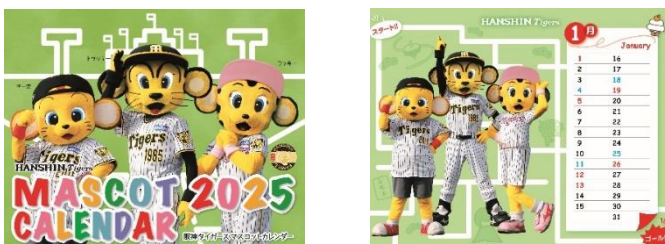
阪神タイガース カレンダー 2025(マスコットタイプ: 表紙・1月オモテ)

阪神タイガースマスコット、トラッキー・ラッキー・キー太の明るく元気な写真とイラストが満載の卓上カレンダー。