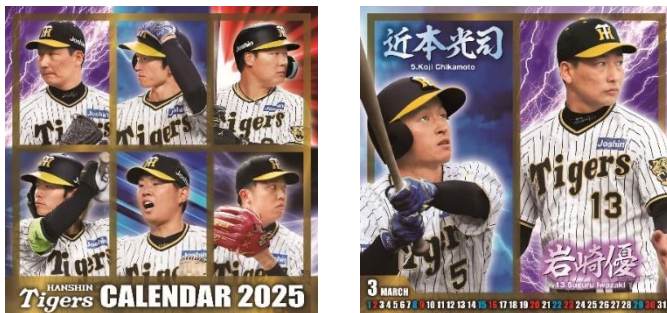
阪神タイガース カレンダー 2025(デスクタイプ: 表紙・3月オモテ)

表面は選手の表情豊かなフォトタイプ、裏面はスケジュールが書き込める選手の誕生日入り卓上カレンダー。