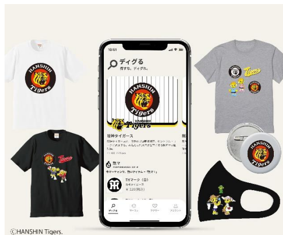
阪神タイガース展開イメージ