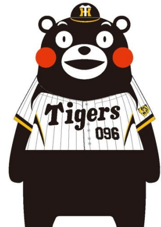
タイガースとコラボくまモン

商 品 名：フェイスタオル デ ザ イ ン：右添付デザイン参照 サ イ ズ：縦 34cm × 横 88cm 価 格：1,050 円（税込） 発 売 日：2012年3月21日（水） 発 売 元：(株)阪神コンテンツリンク 取 扱 店：4月1日までは下記のタイガースショップで限定発売します。