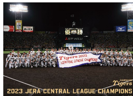
阪神タイガースオリジナルポスター